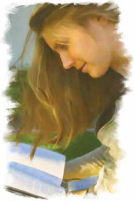
Den Hellige Ånd leder mennesker til bibelsannheter.

Svar: Oppgaven til Den Hellige Ånd er å overbevise meg om synd og lede meg til hele sannheten. Den Hellige Ånd er Guds kraft til omvendelse. Uten Den Hellige Ånd er det ingen som føler sorg over synden, heller ikke blir noen omvendt.