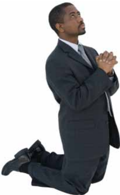
Gud vil tilgi alle synder som jeg bekjenner for Ham.

Svar: Når jeg er blitt overbevist om synd av Den Hellige Ånd, må jeg bekjenne sine synder for å bli tilgitt. Når jeg har bekjent dem, tilgir ikke bare Gud meg, men Han renser meg på mirakuløst vis fra all synd. Gud venter. Han er klar til å tilgi meg enhver synd jeg kan ha begått (Sal 86,5), men bare hvis den blir bekjent og oppgitt.