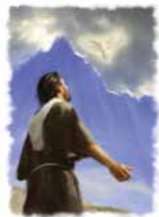
Jesu dåp var en nøyaktig oppfyllelse av Bibelens profeti.