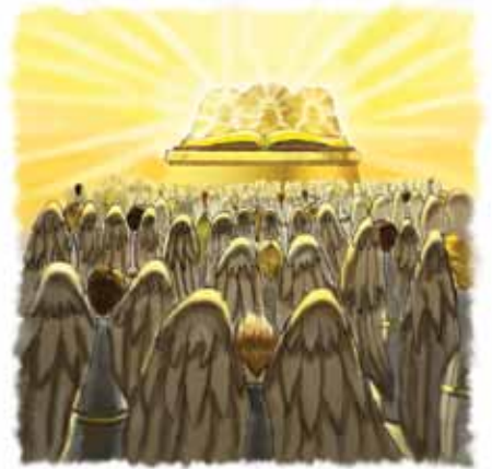
Guds undersøkende dom blir bevitnet av de himmelske hærskarer.

Svar: Det gjenstod 1810 år (2.300 minus 490 = 1.810). Sluttdatoen for profetien er i året 1844 (34 + 1810 = 1844). Engelen sa at den himmelske helligdommen ville bli rensket, eller med andre ord, at den himmelske retten skal bli satt. (Den jordiske helligdommen ble ødelagt i året 70 e. Kr.) Vi lærte i studiehefte 17 at den himmelske forsoningsdagen, eller dommen, var berammet til endetiden. Nå vet vi at denne startet i 1844. Gud forutbestemte denne tiden. Den er like sikker som at året 27 e. Kr. er året da Jesus fremstod som Messias, Guds endetidsfolk må forkynne dette (Åp 14,6.7). Du vil bli overrasket og glad over å få lære om dommens detaljer i studiehefte 19. I Noahs dager erklærte Gud at syndfloden vil ramme jorden om 120 år (1 Mos 6,3) — og det skjedde. I Daniels dager erklærte Gud at Hans endetidsdom ville begynne om 2.300 år (Dan 8,14) — og det skjedde. Guds endetidsdom har pågått siden 1844.