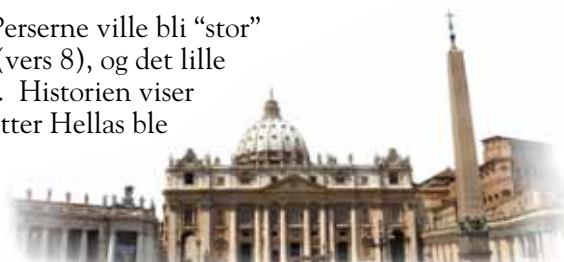
Det “lille hornet” i Dan kap 8 symboliserer Rom i både sin hedenske og pavelige tid. Det lille hornet i de siste dager er derfor pavedømmet.

Og det pavelige Rom “omstyrtet” (vers 11), på en effektiv måte, den himmelske helligdom som ble overgitt til “nedtreddelse” (vers 13) ved å erstatte de vesentligste tjenestene til Jesus, vår Yppersteprest i himmelen, med et jordisk presteembete som hevder å kunne tilgi synder. Ingen foruten Gud kan tilgi synder (Luk 5,21). Jesus er vår eneste Prest og Mellommann (1 Tim 2,5).