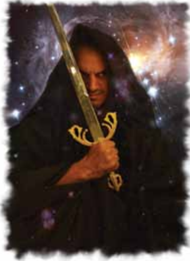
Satan er opphavet til all synd.

Men nei! Jesus, Guds sønn — Guddommeligheten selv — som var mer verdtt enn alle mennesker som noen gang ville komme til å leve på jorden, samtykket i å ofre sitt liv for å betale dødsstraffen for hver synder (1 Kor 5,7). Ved å ta imot Hans offer, ville synderen bli befridd fra syndens straff (Rom 3,25). Den strålende planen inkluderte også at Jesus, hvis Han ble invitert, ville ta bolig i vedkommende (Åp 3,20) og endre ham til å bli en ny person (2 Kor 5:17). Det kreves kraft fra Jesus for å motstå Satan, og bare Han kan gjenskape hver person i Guds bilde, hvori han opprinnelig var skapt (1 Mos 1,26.27; Rom 8,29).