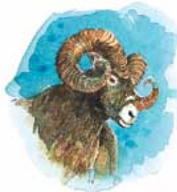
Bukken symboliserer Medo-Persia.