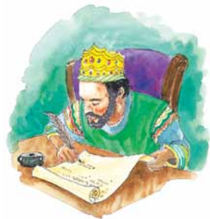
Kong Artaxerxes befaling om Jerusalems gjenoppbygging ble utstedt i år 457 f.Kr.

Svar: Startpunktet var et dekrè fra den persiske kongen Artaxerxes som autoriserte Guds folk (som var i fangenskap i Medo-Persia) til å returnere til Jerusalem og gjenoppbygge byen. Erklæringen som er nedtegnet i Esra kapittel 7, ble utstedt i 457 f.Kr. — i kongens syvende år (vers 7) — og ble iverksatt på høsten. Artaxerxes begynte sin regjeringstid i 464 f.Kr.