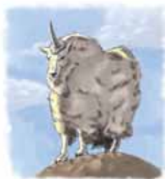
Geita symboliserer Hellas.

Svar: Væren er symbolet på det Medo-Persiske verdensriket, som også ble symbolisert av bjørnen i Dan 7,5. Profetiene i Bibelens bøker, Daniel og Åpenbaringen, følger prinsippene med “gjenta og utvid”. som betyr at de gjentar profetier dekket i tidligere kapitler i boken og utfyller dem. Denne tilnærmingen gir klarhet og visshet i bibelske profetier.