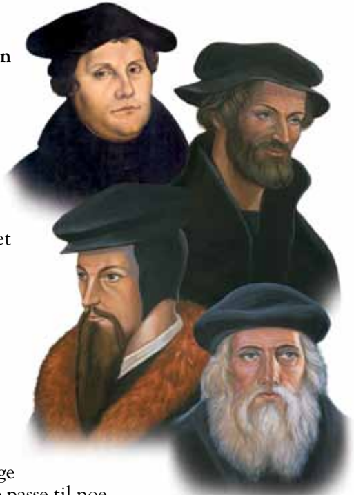
De fleste reformatorer lærte at “Babylon” i Åpenbaringen 17 var pavedømmet.

Merk: Mange av reformasjonens ledere (Huss, Wycliffe, Luther, Calvin, Zwingli, Melanchthon, Cranmer, Tyndale, Latimer, Ridley og andre) lærte at det var pavemakten som var involvert her. 3