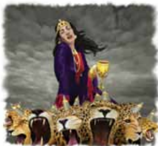
I Åpenbaringsboken kaller Gud denne kvinnen for "Babylon".