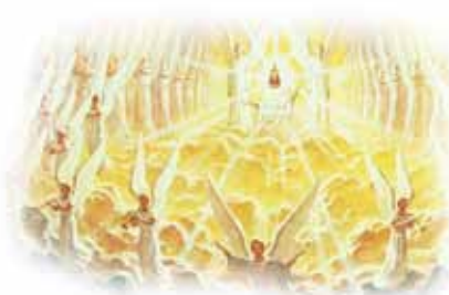
Himmelenes engler vil være på Guds folks side på jordens siste kamp.

Merk: Disse falske lærepunktene, når de blir trodd, pleier å føre til “forvirring” (som er hva betegnelsen “Babylon” bokstavelig betyr) og gjør Skriften mye vanskeligere å forstå.