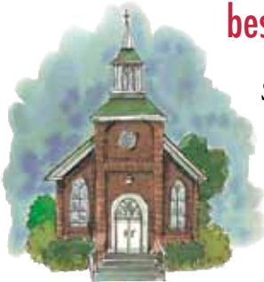
Kirker som adopterer den falske læren til moren Babylon blir selv "Babylon".

Svar: Det er noen av kirkene som opprinnelig protesterte mot Babylons falske lære, og som forlot henne i den store protestantiske reformasjonen. Men senere begynte de å imitere prinsippene og handlingene til moren og ble derfor selv frafalne. Ingen kvinne er født som skjøge. Heller ikke var de protestantiske døtrene som symboliserte kirker, født frafalne. Enhver kirke eller organisasjon som lærer og følger Babylons falske doktriner og praksis kunne bli en fallen kirke eller datter. Så Babylon er et familienavn som omfavner både morkirken og de av hennes døtre som også har falt.