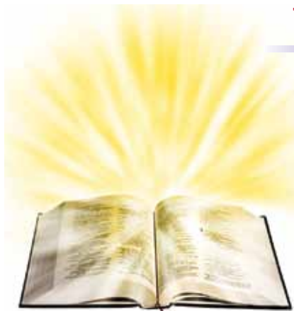
Guds ord avslører Satans strategi.

“Til loven og til vitnesbyrdet! Hvis ikke de taler som dette ordet, får de aldri se morgenrøden.” Jes 8,20.