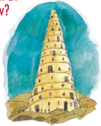
Ordet "Babylon" kommer fra tårnet i Babel. Det betyr "forvirring".

Svar: Ordene "Babel" og "Babylon" betyr "forvirring". Navnet Babylon har sitt opphav fra tårnet i Babel, som ble bygget etter syndfloden av trassige ugudelige som håpet å bygge det så høyt at ikke noe flodvann kunne dekke over det (vers 4). Men Herren forvirret deres språk, og forvirringen som oppstod var så stor at de ble tvunget til å stoppe byggingen. Så kalte de tårnet "Babel" (Babylon), eller "forvirring". Senere, i Det Gamle Testamentets dager, oppstod et hedensk verdensrike kalt Babylon som var en fiende av Israel, Guds folk. Det innbefattet opprør, ulydighet, forfølgelse av Guds folk, stolthet og avgudsdyrkelse (Jer 39,6.7; 50,29.31-33; 51,24.34.47; Daniel kapittel 3 og 5). Faktisk, i Jes kapittel 14 bruker Gud Babylon som symbol på selveste Satan fordi Babylon var så fiendtlig og ødeleggende for Guds arbeid og Hans folk. I Det Nye Testamentets bok Åpenbaringen er betegnelsen "Babylon" brukt for å kjennetegne et religiøst rike som er en fiende av Guds åndelige Israel — Hans menighet (Åp 14,8; 16,19).