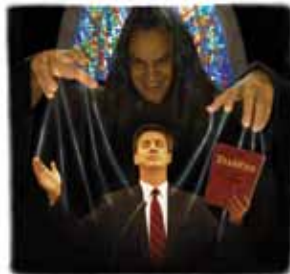
I endetriden vil Satan forføre alle som ikke krever klare bevis fra Skriften for hver bibelsk doktrine.

Svar: Enda Satan hater Gud og Hans Sønn, er det sjelden han innrømmer det åpent. Faktisk vil han og hans demoner utgi seg for å være hellige engler og hellige kristne prester (2 Kor 11,13-15). De bevisene han presenterer for sin sak vil virke så rettferdig, åndelig og likt Jesus, at nesten alle på jorden blir forført og følger ham (Matt 24,24). Han vil uten tvil bruke Bibelen, som han gjorde da han fristet Jesus i ødemarken (Matt 4,1.11). Satans logikk er så troverdig at han lurte en tredjepart av englene i himmelen, Adam og Eva og (ved syndfloden) hvert menneske på jorden unntatt åtte personer.