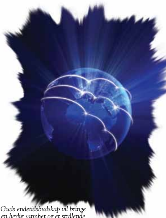
Guds endetidsbudskap vil bringe en herlig sannhet og et strålende lys til hver person på jorden.

Svar: I Skriften representerer engler budbærere, eller budskap (Hebr 1,13.14). Guds endetids-appell er symbolisert av en mektig engel med en kraft så stor at hele jorden blir opplyst med Guds sannhet og herlighet. Dette avgjørende, Gudgitte budskapet vil gå til innbyggerne i hele verden. (Åp 14,6; Mark 16,15; Matt 24,14).