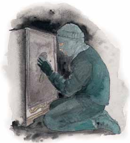
Gud betrakter folk som ikke betaler tiende og gir gaver som røvere.

Svar: Han omtaler dem som røvere. Kan du forestille deg mennesker som stjeler fra Gud?