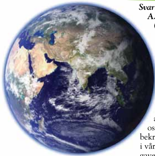
Verden og alt i den tilhører Gud.