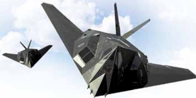
Mange nasjoner ber USA om beskyttelse og støtte.