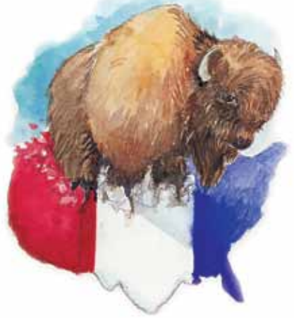
Dyret i Åp 13,11-18 symboliserer USA.

Svar: Det pavelige fangenskapet som er nevnt i vers 10 fant sted i 1798, og den nye makten (vers 11) kom til syne på den tiden. USA erklærte sin uavhengighet i 1776, stemte for grunnloven i 1787, inntok rettighetsproposisjonen i 1791 og fremstod tydelig som en verdensmakt i 1798. Tidspunktet passer tydelig på USA. Ingen annen makt vil kunne passe.