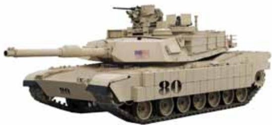
USA er verdens ledende militærmakt.

Da en marksistisk gruppe styrte regjeringen i Etiopia, ble USA bedt om å forhandle. Da Boris Yeltsin ble innsatt som president i det nylig uavhengige Russland, besøkte han først USA. Forhenværende U.S.S.R. president Mikhail Gorbatsjov henvendte seg til USA i sin krise. Da Kuwait ble invadert, ba Kuwait USA om hjelp. Den USA-ledede krigen mot Irak fikk støtte fra nesten hele verden. En nasjonal offentlig radiokorrespondent kalte den amerikanske presidenten for “verdens president”. Vi har nå “en høyst uvanlig verdensstruktur med en eneste makt, USA, på toppen av det internasjonale systemet”. Krauthammer, The New Republic , p. 23.