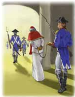
I 1798 tildelte general Berthier pavemakten et dødelig sår ved å arrestere paven.

Svar: Bibelen forutsa at pavemakten ville miste sin makt og sitt verdensherredømme etter 42 måneder. Profetien ble oppfylt i 1798, da Napoleons general Berthier fengslet paven og pavemakten ble påført sitt dødelige sår. (For alle detaljer se studiehefte 15.)