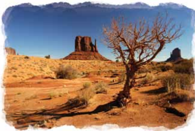
Profetiene forutsa at USA ville oppstå i et tynt befolket område.

Åp 17,15. Derfor representerer jorden det motsatte. Det betyr at den nye nasjonen ville oppstå i et område i verden som praktisk talt var ubefolket til slutten av 1700-tallet. Den kunne ikke oppstå blant de overbefolkede og stridende nasjonene i den gamle verden. Den måtte stå frem fra et sparsomt befolket kontinent.