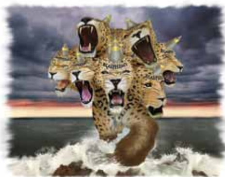
Dyret i Åp 13,1-10 symboliserer pavemakten.

Svar: Dyret med de syv hodene (Åp 13,1-10) er ikke noe annet en den romerske pavemakten. (Se studiehefte 15 for fullstendig innsikt i dette tema.) Husk at dyr i bibelske profetier symboliserer nasjoner eller verdensriker (Dan 7,17.23).