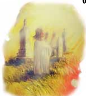
1.000-års perioden begynner med oppstandelsen av de rettferdige.

“Og de levde og regjerte med Kristus i tusen år.” Åp 20,4. (Se studiehefte 10 for mer informasjon.)