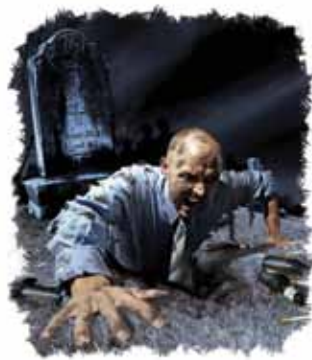
1.000-års perioden ender med oppstandelsen av de ugudelige.

Vennligst merk: De rettferdiges oppstandelse er starten på de 1.000 år. De ugudeliges oppstandelse er slutten på de 1.000 år.