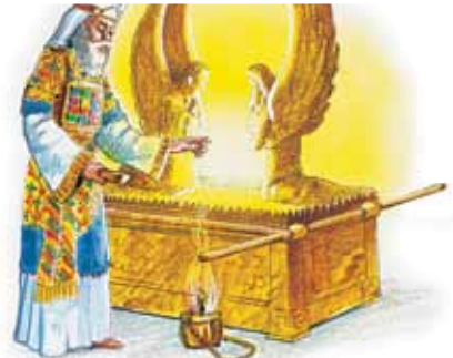
Prestens tjeneste foran nådestolen representerer Jesu tjeneste for oss i himmelen.