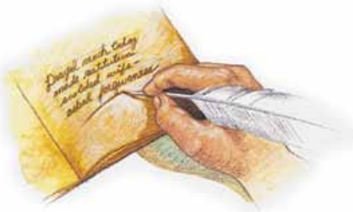
Bevisene fremlagt i dommen kommer fra himmelens bok.

ukjærlig og løgnaktig. Dette gjør det enda viktigere for alle vesener i universet å få førstehåndsinformasjon om hvor ekstremt tålmodig Gud har vært med alle syndere. Frikjennelsen av Guds karakter er hovedgrunnen til rettssaken (Åp 11,16-19; 15,2-4; 16,5,7; 19,1,2; Dan 4,36,37). Legg merke til prisen og æren som blir gitt til Gud for måten Han har håndtert rettssaken på.