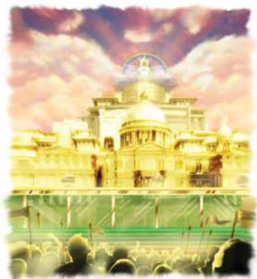
Dommens tredje fase vil sette en stopper for planen om å angripe byen.

Plutselig er der en bevegelse. En fortapt sjel faller på sine knær for å innrømme sin skyld og åpent bekjenner at Gud har vært mer enn rettferdig mot ham. Hans egen hardnakkede stolthet hindret ham fra å reagere. Og på alle kanter kneler nå mennesker og onde engler. Så, i en eneste stor, nesten synkronisert bevegelse, faller de gjenværende fortapte mennesker og engler, inkludert Satan, på sine knær foran Gud (Rom 14,11). Åpenlyst frikjenner de Guds navn fra alle falske beskyldninger, og vitner om Hans kjærlige, rettferdige og nådige behandling av dem.