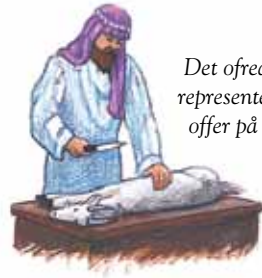
Det ofrede dyret representerte Jesu offer på korset.

Svar: I studiehefte 2 lærte vi hvordan Satan urettmessig anklaget og utfordret Gud og brakte den stygge ondartede synden inn i universet. Forsoningsdagen i det gamle Israel lærte, gjennom symbolikk, hvordan Gud vil håndtere problemet synd og gjenskape harmonien i universet ved forsoningen. (Forsoning betyr “gjenoppsettelse”, eller “å bringe alle ting inn i total guddommelig harmoni”). I den jordiske helligdommen var de symbolske trinnene som følger: