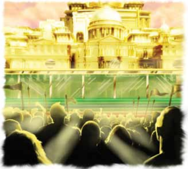
De ugudelige vil prøve å angripe den hellige byen.

Svar: Dommens tredje fase vil finne sted på jorden, ved slutten av de 1.000 år i Åp. kap. 20 — etter Jesu retur til jorden med den hellige byen. Alle de ugudelige som noen gang har levd vil være til stede, inkludert djevelen og hans engler. Etter de 1.000 år, vil alle de døde fra alle tidsaldre stå opp (Åp 20,5). Umiddelbart lanserer Satan en kraftig propagandakampanje for å forføre dem. Utrolig nok lykkes han med å overbevise jordens nasjoner om at de kan innta den hellige byen.